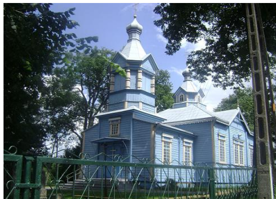
Cerkiew prawosławna św. Barbary w Milejczycach