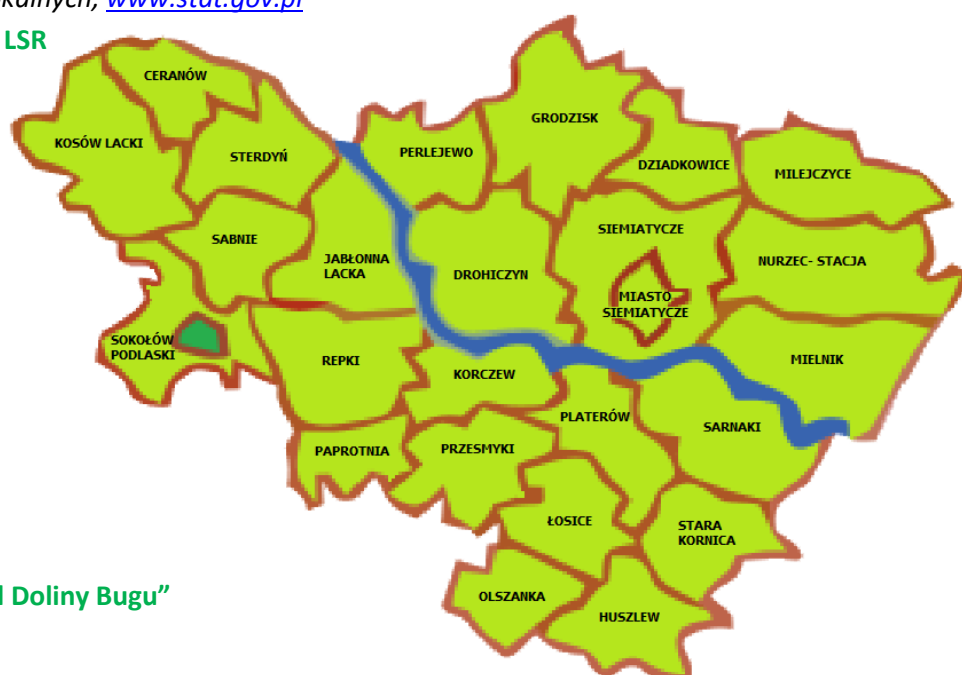
Mapa 1. Gminy SLGD „Tygiel Doliny Bugu”